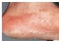
マルホ(株)ホームページ引用