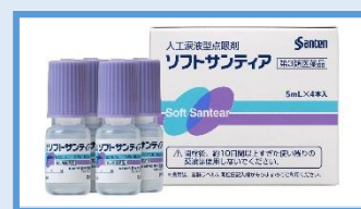
人工涙液型点眼剤 ソフトサンティア® 第3類医薬品